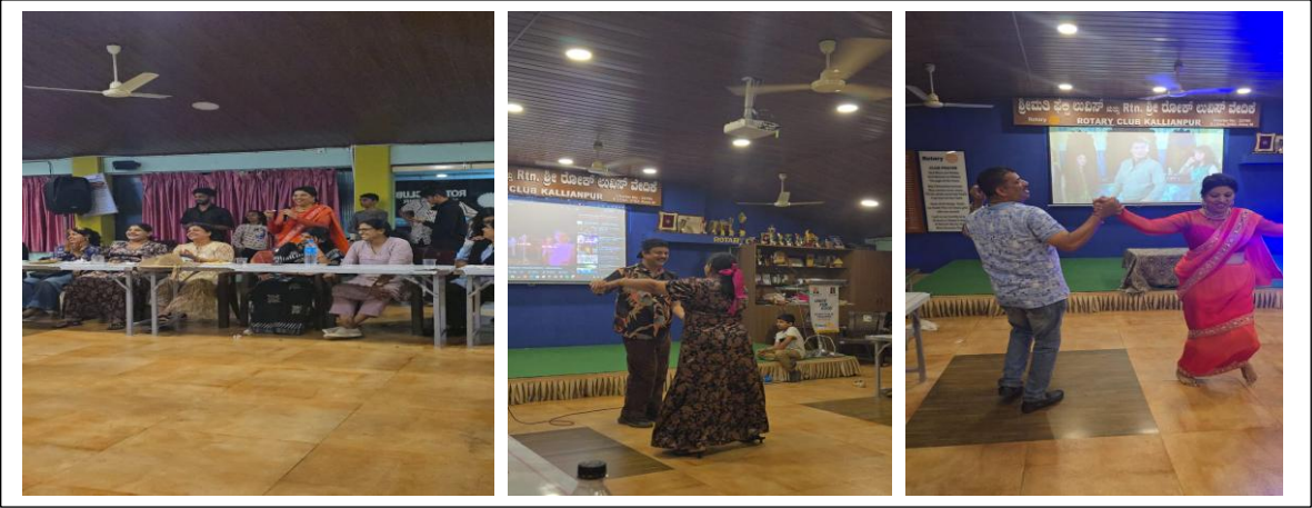
ನಮ್ಮ ರೋಟರಿ ಭವನದಲ್ಲಿ ನಡೆಸಿದ ಹೊಸ ವರ್ಷದ ಸಂಭ್ರಮ